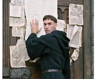
(aus dem Film „Martin Luther“)

Mit „Gottesdienst anders“ und „Kirchen-Kino“ für jung und alt in Neundorf feierten wir das 500. Jubiläum Martin Luthers Anschlag der 95 Thesen, die 1517 die Reformation auslösten.